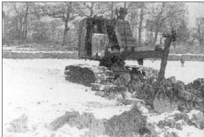
Bagrování Hamerského rybníka