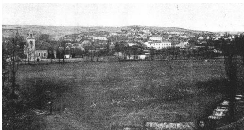
Hamerský rybník - 1. polovina 20. stol.

Dokonce i náš Spořilov má "svůj ostrov" ... nebo řekněme spíše malý ostrůvek, který najdete přesně uprostřed Hamerského rybníka. Je to takový symbol našeho rybníka. Tento ostrůvek je po většinu roku klidným domovem vodního ptactva a dalších živočichů, ale lidmi trvale "obydlen" není. Je totiž velký asi jako byt 1+1. Ostrůvek zabírá plochu kolem 30m 2 . Právě v období, kdy není rybník zamrzlý je i ideálním místem pro zelené keře a traviny všeho druhu. Hustota zeleně ve vegetačním období je dobrá právě pro hnízdící ptactvo, které tady nalézá klid od civilizace a husté zástavby, která je všude kolem. Nejvíce vegetace najdeme ve východní části ostrůvku. Poslední zimy jste tady mohli spatřit hnízdící kachny a dokonce i dvě labuťe.