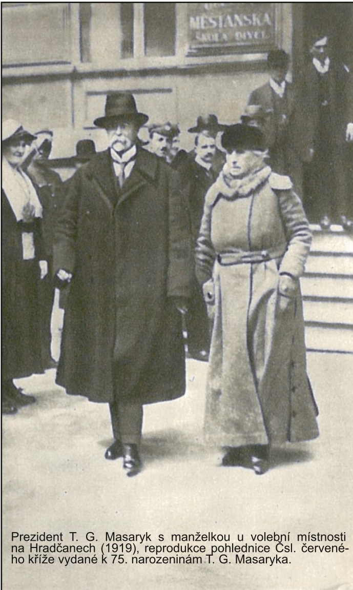
Prezident T. G. Masaryk s manželkou u volební místnosti na Hradčanech (1919), reprodukce pohlednice Čsl. červeného kříže vydané k 75. narozeninám T. G. Masaryka.